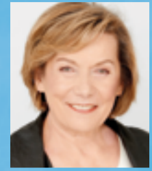
Sonja Zwazl > Präsidentin WKNÖ